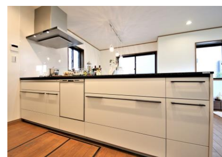
パナソニック製Lクラス キッチン