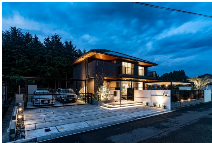
総合デザインコース 最優秀賞事例 外観 [設計:パナソニック ホームズ大分(株)]

今回選出された優秀事例に対する審査員の概評は、オーナー様の住まいに対する思いを引き出して具現化できているか、オーナー様の期待を超えるアイデアや魅力付けができているかが、評価のポイントとなりました。