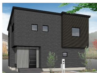
東和総合住宅(株) 延床面積 118.82 ㎡