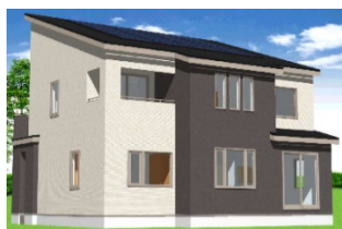
(株)ウェルズホーム福島 延床面積 113.85 ㎡