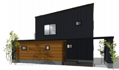
(株)松浦建工所 延床面積 118.5 ㎡