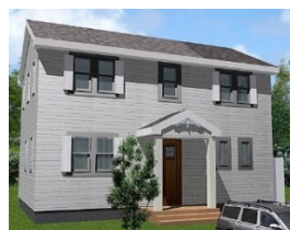
セルコホーム(株) 延床面積 115.96 ㎡

戸建街区「ソラチエ」では、モデルハウス棟のオープンに際し、『まちびらきフェスタ』をGW 中の 4 月 29 日～5 月 1 日の 3 日間開催いたします。同フェスタでは、モデルハウス棟の一斉見学会を行うと共に、地域連携として、福島市や伊達市にある飲食店・物販店・農家などが集う「マルシェ」を出店するほか、福島学院大学の学生による「未来の街づくりワークショップ」や、地元を拠点に活動するバンドによる演奏が行われます。