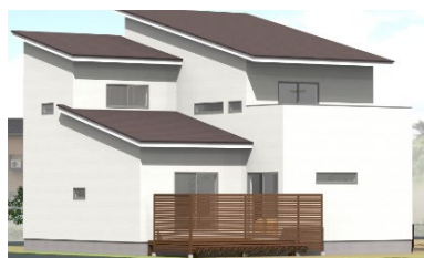
アイフルホーム福島北店 延床面積 114 ㎡

このたび 4 月 29 日(祝)にオープンするのは、アイフルホーム福島北店・東和総合住宅(株)・(株)土屋ホーム・(株)松浦建工所・(株)ウェルズホーム福島・(株)創作家・セルコホーム(株)が新築したモデルハウス 7 棟。全棟は、前述した「家並み創造」の要件を満たし、各社、個性豊かに外観や間取り、設備・仕様の工夫を施し快適な暮らしの提案と環境負荷低減に貢献します。