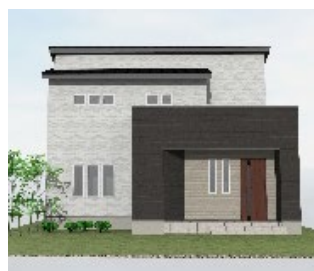
(株)土屋ホーム 延床面積 107.85 ㎡